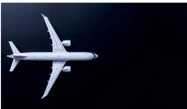
Lodewijk van Maaseik

A false flag terror attack Conspiracy, crash, cover-up