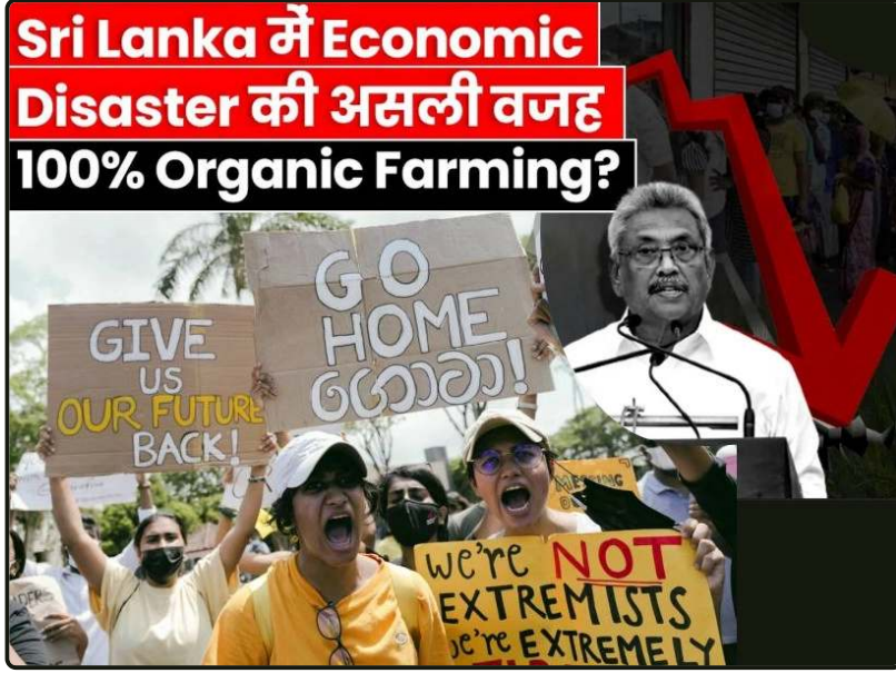
سريلانكا كارثة اقتصادية