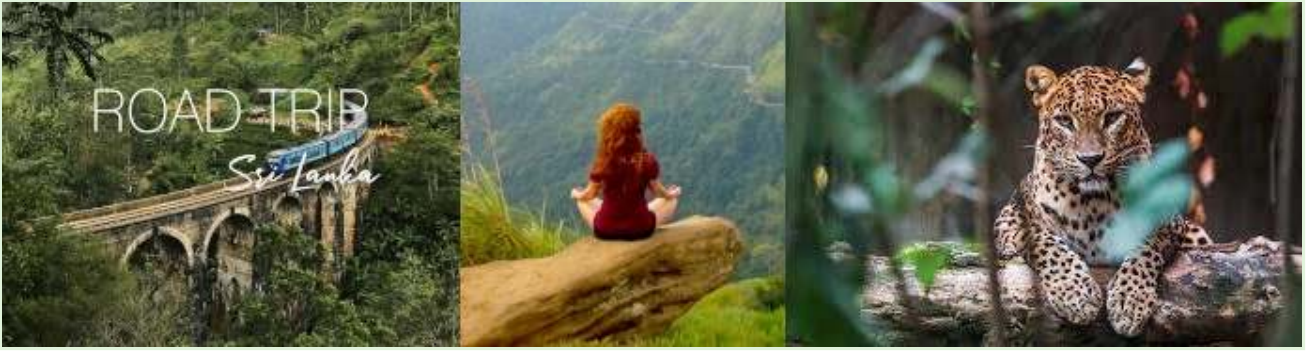
عطلات سريلانكا - جولات ورحلات استكشافية في الطبيعة بصحبة مرشدين

التوقيت: تم إطلاق التجربة خلال جائحة كوفيد-19، عندما تأثر اقتصاد سريلانكا المعتمد على السياحة بشدة بالفعل.